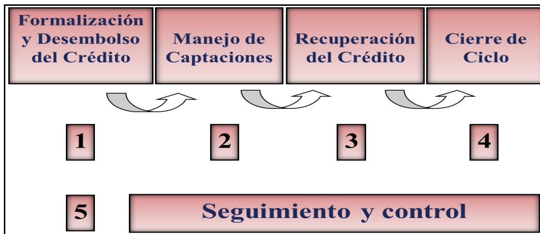
Gráfica 8. Operación de la Ventanilla Rural Cooperativa