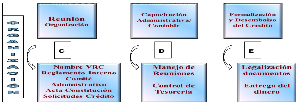
Gráfica 7. Constitución de una Ventanilla Rural Cooperativa

La comunidad es la garante solidaria de los créditos entregados, que tienen un monto igual para todos sus miembros. La ventanilla inicia con la entrega de cantidades pequeñas (entre $400 y $600 USD) y su valor se incrementa en función de la capacidad de ahorro y la cultura de pago de la comunidad (hasta 1.000USD). Para acceder a un nuevo crédito, la Ventanilla debe cancelar en su totalidad el crédito anterior a la cooperativa. Esta condición exige a todos los miembros mantenerse al día en el pago de sus cuotas.