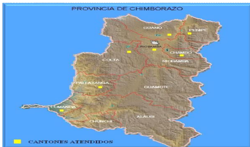
Gráfica 4. Cantones atendidos por las VRC

Los Cantones de la Provincia de Chimborazo y en especial el Cantón Penipe, en el cual ha incursionado VRC en sus inicios, ha sido históricamente relegados de servicios financieros, si bien existe una población considerable en todas las parroquias rurales de este Cantón (refiérase al gráfico 4 para su ubicación geográfica), éstas no han podido acceder a servicios financieros por la cantidad de documentos exigidos, además de los altos costos de transacción, lo cual ha ocasionado que no exista un flujo mayoritario de personas con experiencia crediticia. El difícil acceso a sectores rurales es otro factor que impide que las personas puedan mejorar su calidad de vida por todos los gastos que implica trasladarse de un lugar a otro sin tener los medios necesarios.