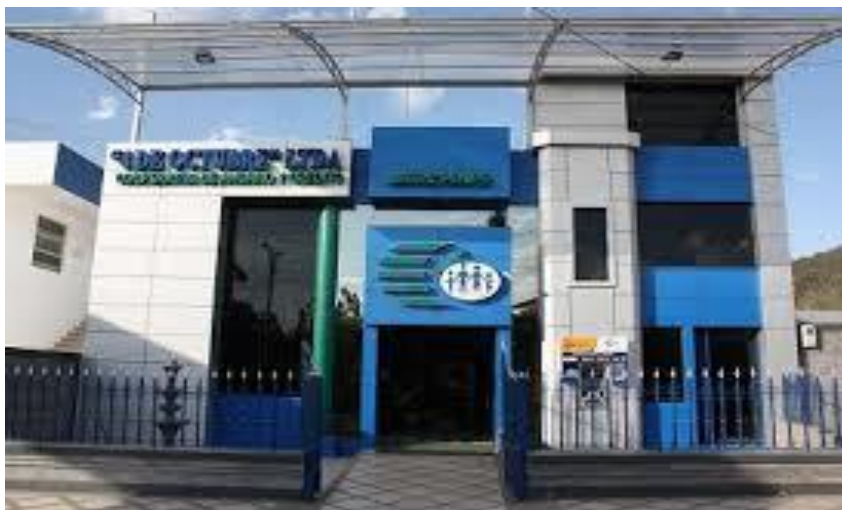
Gráfico 1. Instalaciones de la Cooperativa 4 de Octubre (matriz)

Orientados siempre por su misión, y buscando atender a grupos menos favorecidos, han implementado en su sistema la herramienta de PPI (Estudio de Pobreza) y de esta manera pueden monitorear los niveles de pobreza de sus clientes. Lo cual se considera como una importante fortaleza para la mejor toma de decisiones de la Gerencia General y la Junta.